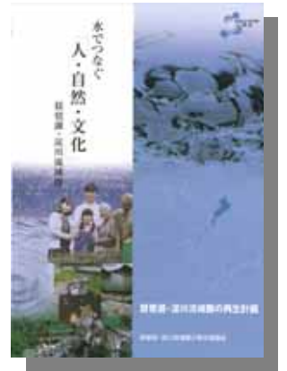
「琵琶湖・淀川流域圏の再生計画」 (平成17年3月策定)

平成17年4月には「琵琶湖・淀川流域圏再生推進協議会」を設置し、流域圏再生に向けた取り組みを関係機関が流域圏のあらゆる関係機関と流域圏の個々の活動を繋いだ「琵琶湖・淀川流域圏連携交流会（BY-net）」と連携して具体的に進めているところです。